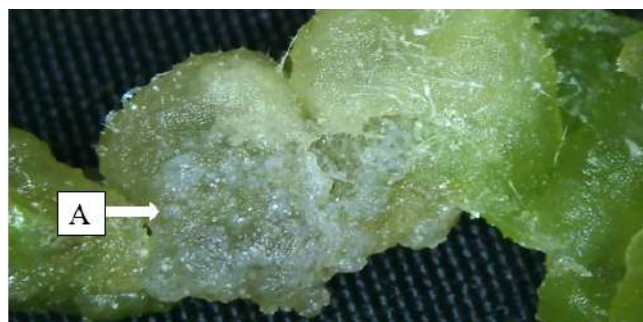
Figura 3. Posibles brotes a partir de cotiledones en concentración 0.1 \text{ mg L}^{-1} . A) embriones en estado globular.

En la Figura 3, se aprecia un posible brote formado de tejido de cotiledón, así como pequeñas aglomeraciones acompañados de raíces adventicias. Estas aglomeraciones blancas podrían ser embriones en estado globular ya que no mostraban conexión con el tejido vascular. Las células del centro del embrión del callo se dividen rápidamente y se forman embriones globulares que crecen y desarrollan pasando por los estados de corazón, torpedo y cotiledonar, luego maduran y germinan dando lugar a plantas completas (Ammirato, 1989; Winkelmann, 2016). En este sentido, durante el desarrollo de brotes a partir de tejido de cotiledón con 0.1 \text{ mg L}^{-1} de AIA, se encontró el estado globular, como primera etapa del desarrollo embrionario a las cuatro semanas, mientras que los demás estados de desarrollo no se observaron.